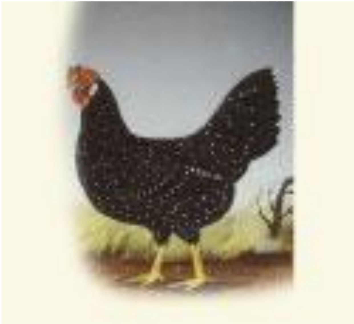
Anaconda - Pullets