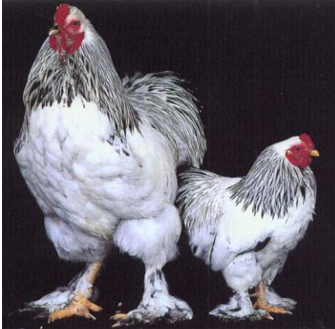
Standard and Bantam Light Brahmas