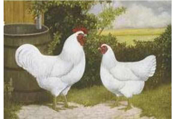
White Jersey Giants