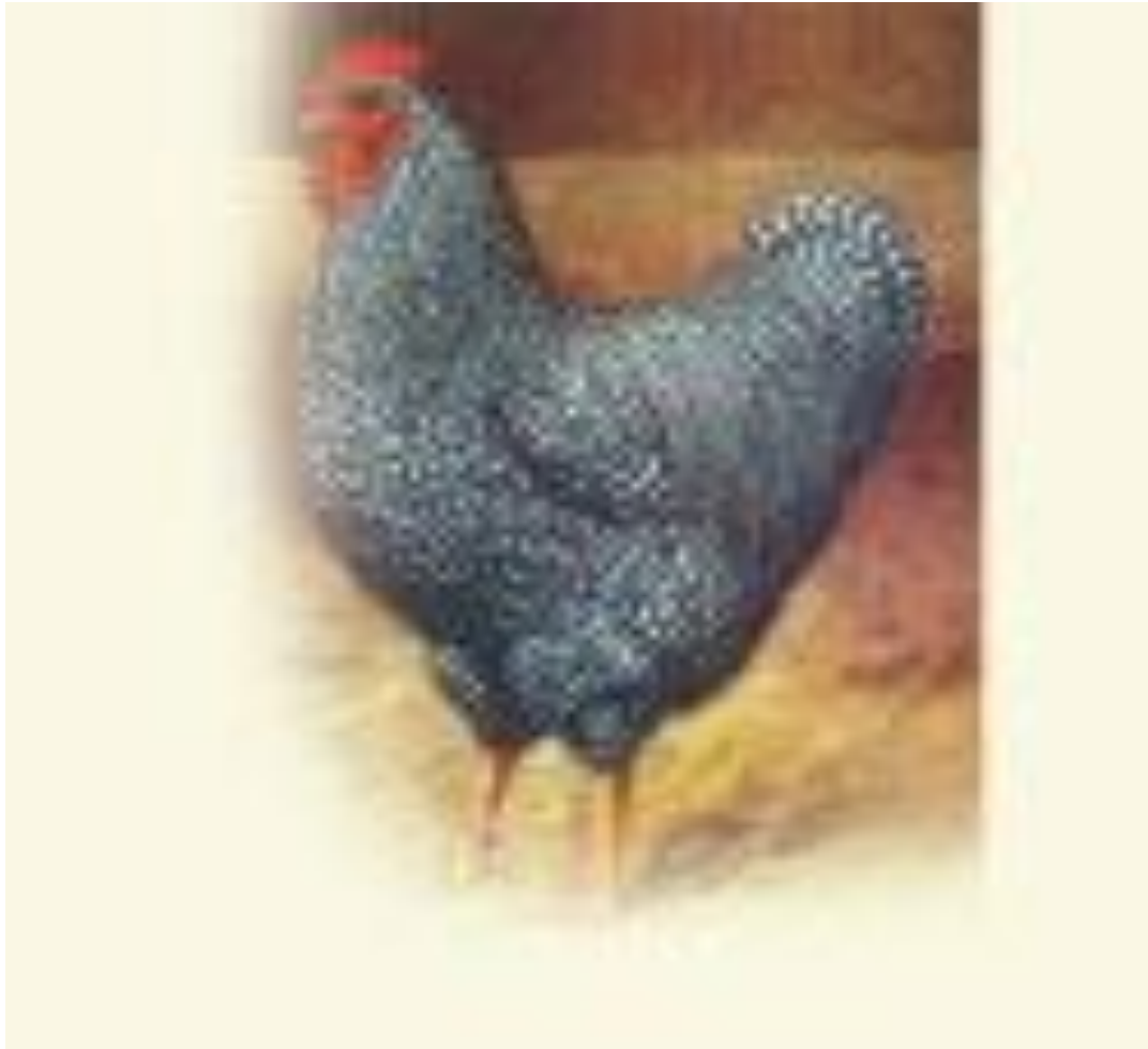
Barred Rock - Males