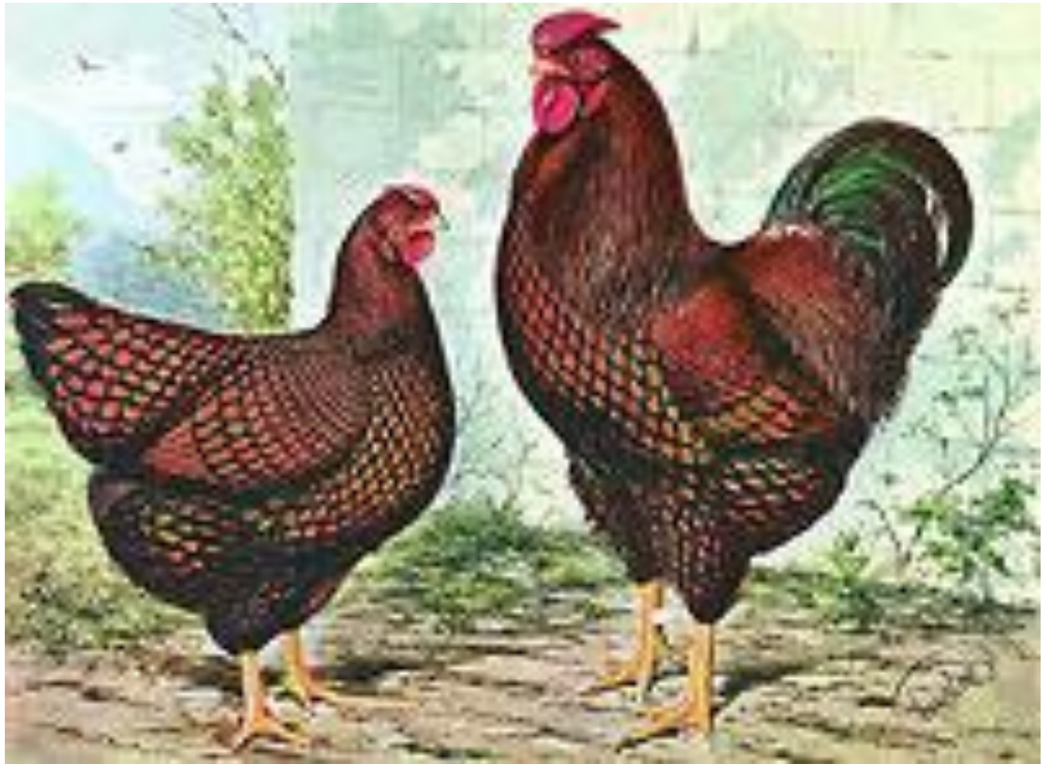
Gold Laced Wyandottes