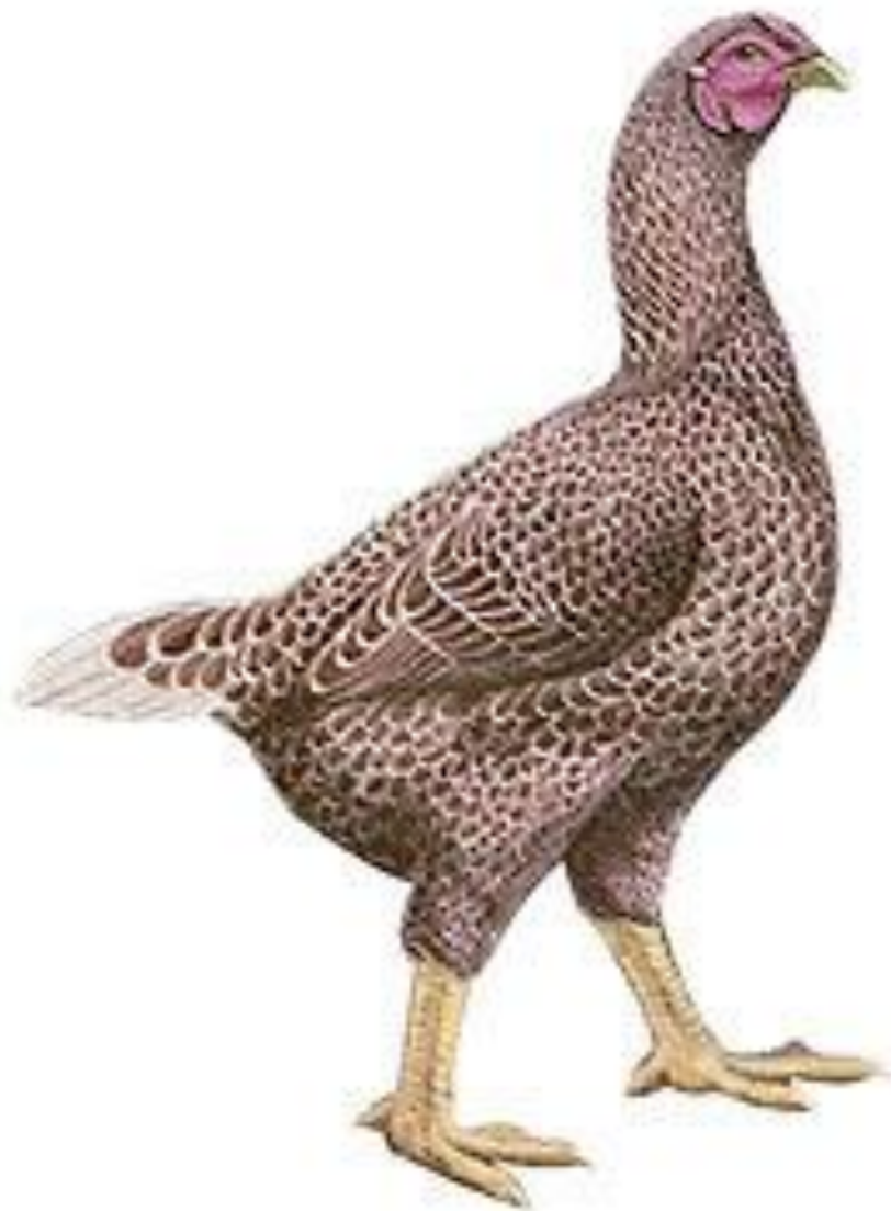
White Laced Red Cornish