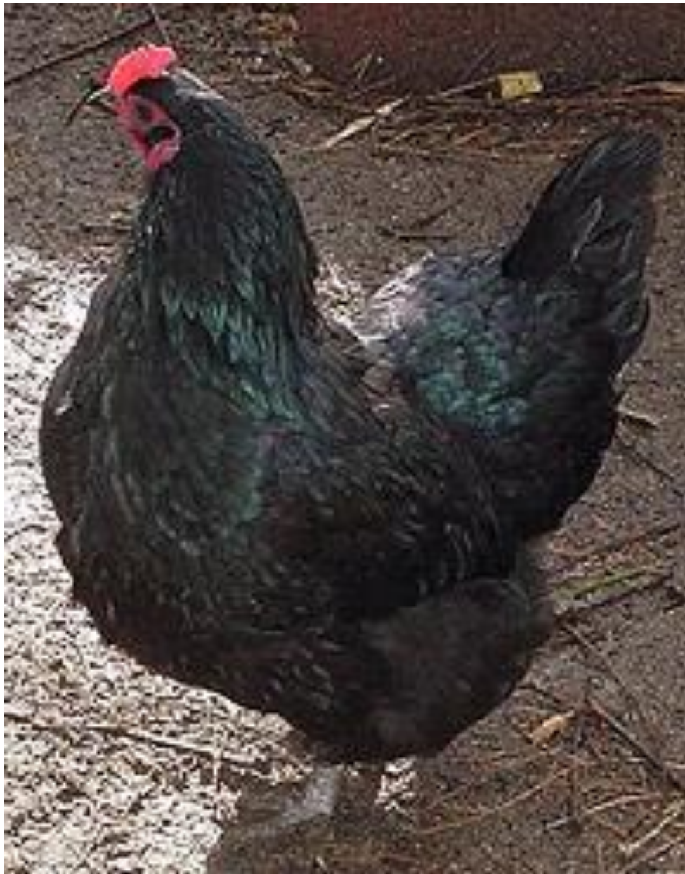
Black Australorp hen