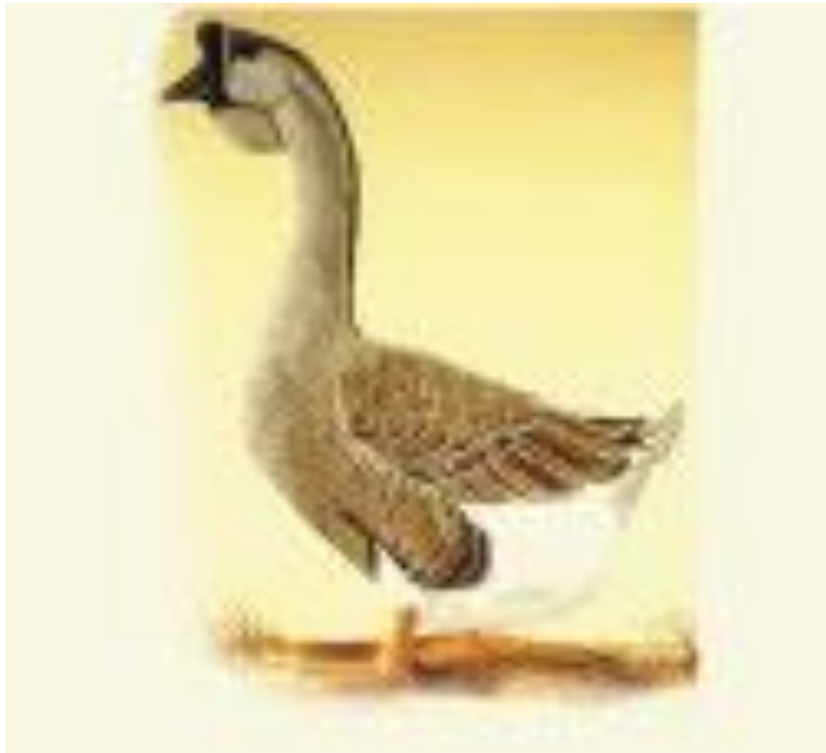
African Goose - Straight Run